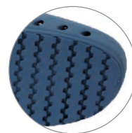
SUOLA ANTISCIVOLO ANTISLIP SOLE